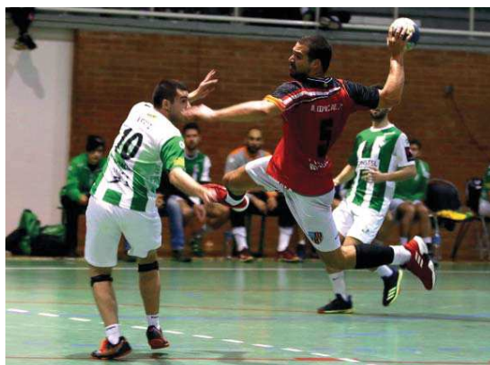
El CH La Salle va encaixar la quarta derrota seguida a la pista de l'OAR Gràcia (29-20)