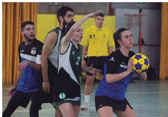
El CK Montcada A és el vigent subcampió de la Copa Catalana A i vol arribar a una nova final