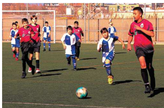
L'infantil B de l'FB Montcada va empatar contra el CE Sabadell E (1-1) el 27 de gener, a la Ferreria

L'equip vermell juga a Segona Divisió i ha trencat una ratxa de tres derrotes seguides