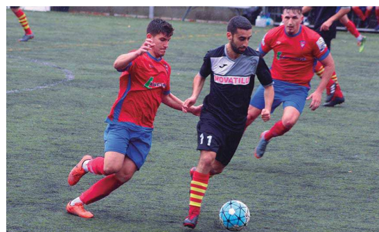
La UE Sant Joan-Atlètic només ha guanyat dos dels nou partits que ha disputat com a local

dues derrotes seguides contra el CF Lloret (2-1) i el CF Palamós (2-3). “Som conscients que estem en una situació delicada, però no creiem que ja estiguem sentenciats. La plantilla està compromesa i la clau serà fer-nos forts en els nostres partits a casa” , ha dit Hidalgo | RJ