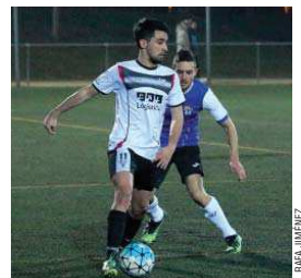
La UD Santa Maria s'ha refet de dues derrotes

La UD Santa Maria va superar amb bona nota la visita que el CE Lliçà d'Amunt va fer el 9 de març a l'estadi de la Ferreria i continua ocupant el cinquè lloc al grup 9è de Tercera Catalana. L'equip de Robert Villa, que havia perdut el seus dos partits previs, va golejar per 5 a 1 un rival que aspirava a superar-lo a la classificació | RJ