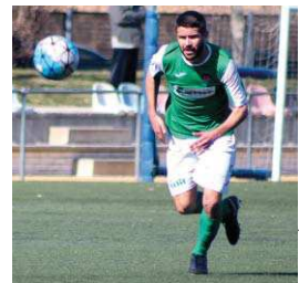
Els verds han entrat en un sotrac de resultats

Els verds han baixat fins al quart lloc a Segona Catalana