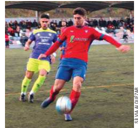
La UE Sant Joan ho té complicat per evitar baixar

La UE Sant Joan-Atlètic segueix sense reaccionar i, amb només 17 punts, continua sent el cuer al grup 1r de Primera Catalana. A manca de 10 jornades per acabar la lliga, l'equip de Paco Hidalgo es troba a 10 punts de la salvació després d'encaixar el 10 de març la seva tretzena derrota de la temporada al camp de la UE Rubí (1-0) | RJ