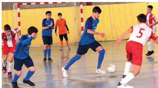
L'infantil A només ha encaixat cinc derrotes aquesta temporada al grup 4t de Primera Divisió

i FS Ripollet. Després d'haver encaixat dues derrotes seguides contra el Futsal Vicentí (3-1) i l'FS Sant Cugat (2-5), l'infantil A es va retrobar amb la victòria a la pista del CFS Cornellà B (1-6) i està situat, a manca de nou jornades, a un punt del segon, l'FS Sant Andreu de la Barca, i a nou del líder, l'FS Olesa | RJ