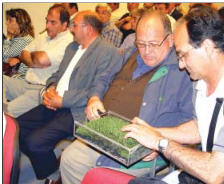
>> Els assistents van poder comprovar com serà la gespa dels camps

L'ARQUITECTE "Serà un equipament de qualitat pel que fa al confort i materials"