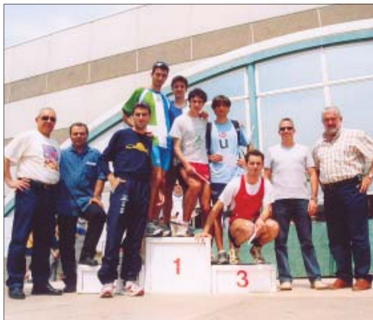
>> Els sis primers classificats de la general amb les autoritats municipals