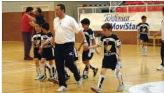
>> Els benjamins van aconseguir la segona posició