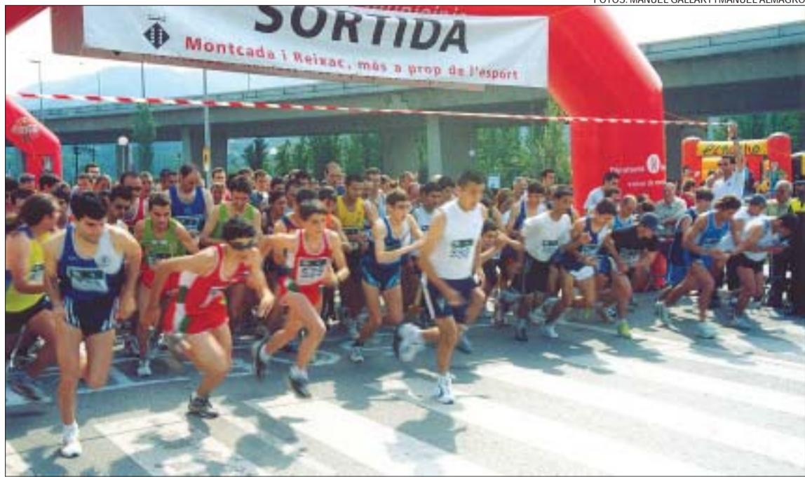
>> Moment de la sortida de la cursa de 5.500 metres, que va comptar amb un total de 123 participants