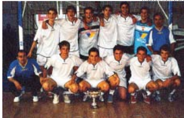
>> Equip cadet A del Vitelcom Montcada