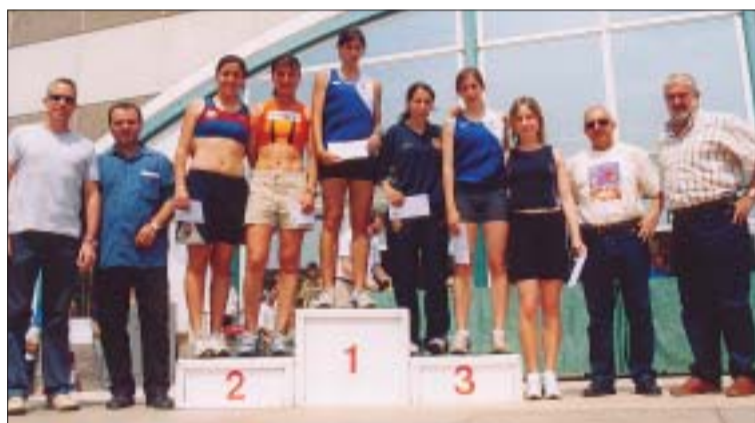
>> El podi amb les sis primeres classificades en categoria femenina

El canvi d'ubicació de la sortida i l'arribada, davant del pavelló Miquel Poblet, va agradar als corredors i als espectadors. Els